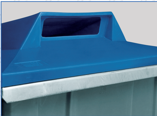
...eller for papirinnkast.