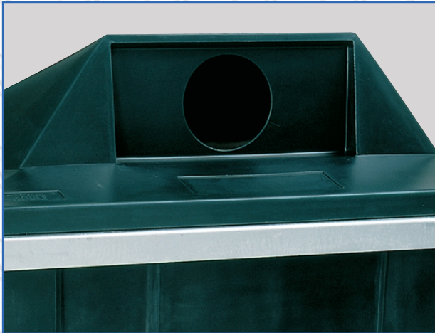
Kan leveres med lokk-løsning for glassinnkast...

En fleksibel container med mulighet for lokk-løsninger for kildesortering. Flere varianter spesiallages med farger for forskjellige avfallstyper.